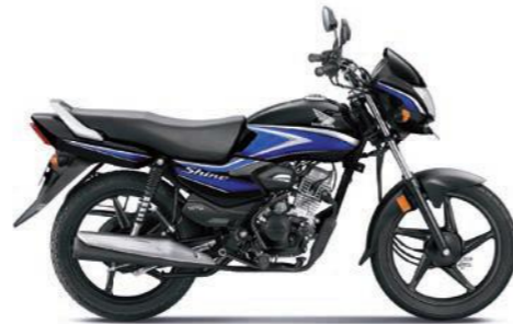
ब्लू के साथ ब्लैक