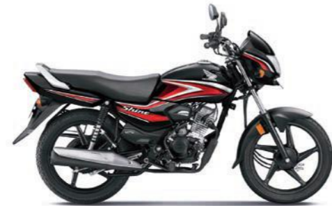
रेड के साथ ब्लैक