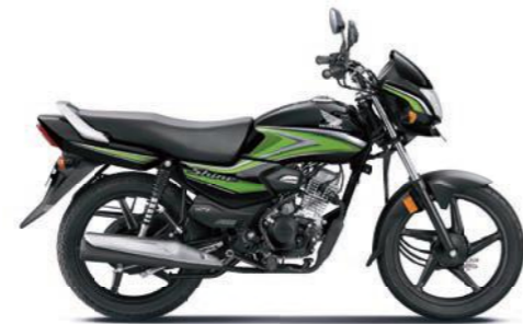
ग्रीन के साथ ब्लैक