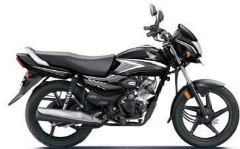
ग्रे के साथ ब्लैक

अभी ऑनलाइन बुक करें! www.honda2wheelerindia.com