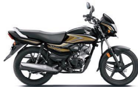
गोल्ड के साथ ब्लैक